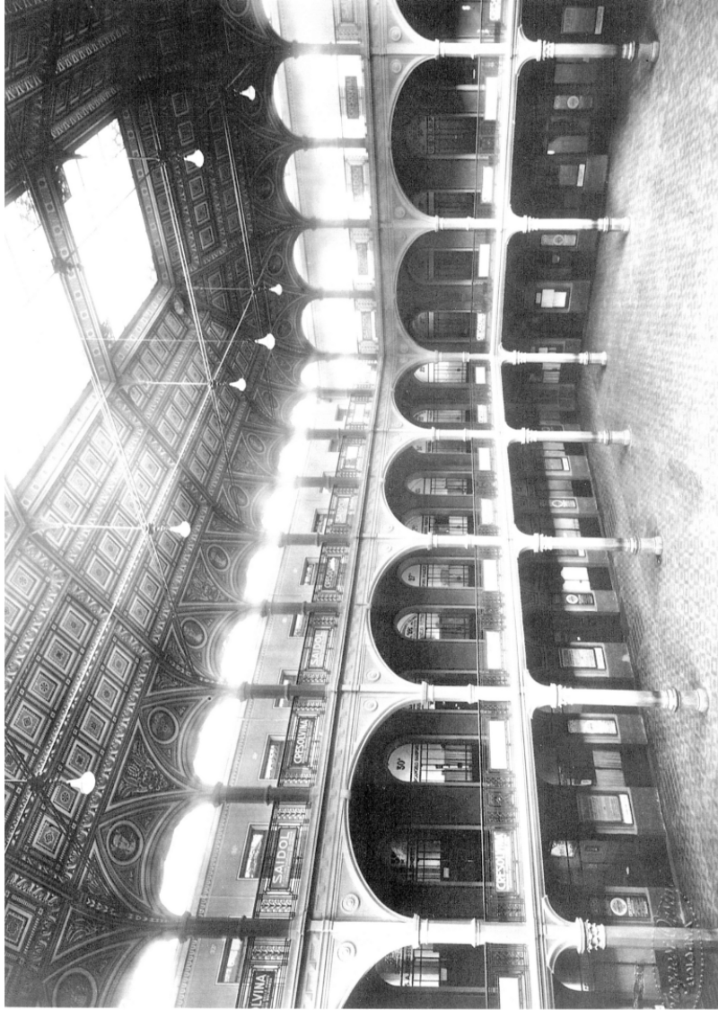
La suggestiva scenografia della "Sala Borsa", in via Ugo Bassi a Bologna, dove nell'ottobre 1933 si trasferì il Direttorio della VII. Zona (Emilia). I due locali da esso occupati si trovavano nel piano più alto, indicati dalla freccia. Dopo la guerra vi trovarono posto la Lega Regionale Emiliana, la Lega Giovanile e il Settore Giovanile, quest'ultimo fino al 1972.